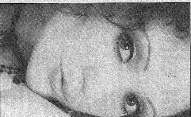
Reda präsentiert eine Weltpremiere im »Blue Heaven«.

hat sich auf den russischen Hip-Hop spezialisiert. Gemeinsam mit Joe D (seinem Produzenten) wird er sein Album vorstellen, das kurz vor dem Abschluss steht. »Rival weiß sehr gut, wie man Rap und